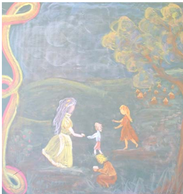
Táblarajz, II. osztály

Másodikban már állatokról és a szentekről, a két polaritásról mesélünk, mert érdekes tulajdonságok jelennek meg bennük. Egyik esetben olyanok, mint egy kis állatka, ravasz cseles, kicsit behúzza a másikat a csöbe, bántja, másik esetben meg teljes áhítattal ott van valamiben. Érezze meg, hogy igen ezek a minőségek megvannak a világban és lehet azért nemesíteni, de tudomásul is kell venni, hogy jelen vannak.