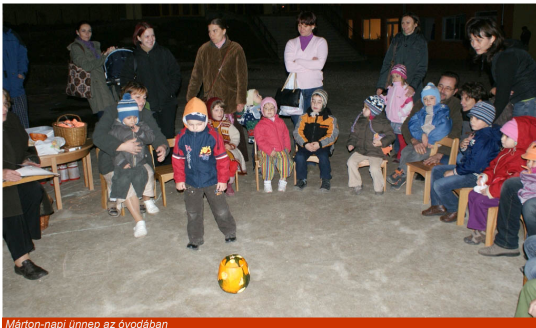
Márton-napi ünnep az óvodában