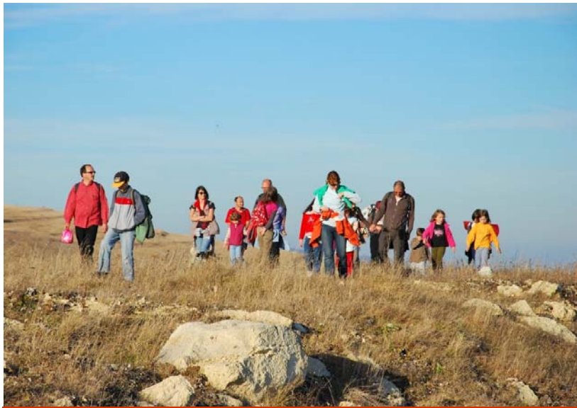
Kirándulás a Székelykőre – 2010. november 13.

nagy örömünkre szolgál, hogy újra iskolaújságot készíthetünk. Igyekszünk évszakonkénti rendszerességgel jelentkezni. Olvassátok szeretettel!