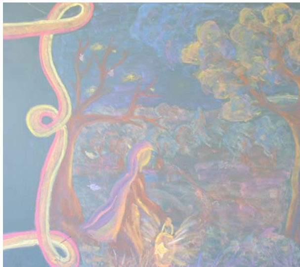
Táblarajz, II. osztály

erdőben lakó törpéknek, manóknak. A kisiskolások is megteszik ezt – hiszen ők még eléggé közel vannak a manók és tündérek világához –, de ők már meghallgatnak Szent Márton életéből egy-egy történetet, és ami a legfontosabb: a szülők sütnek egy-egy Márton-napi pogácsát a gyerekeknek, és azt az ünnepség végén mindenki megfedezi valakivel.